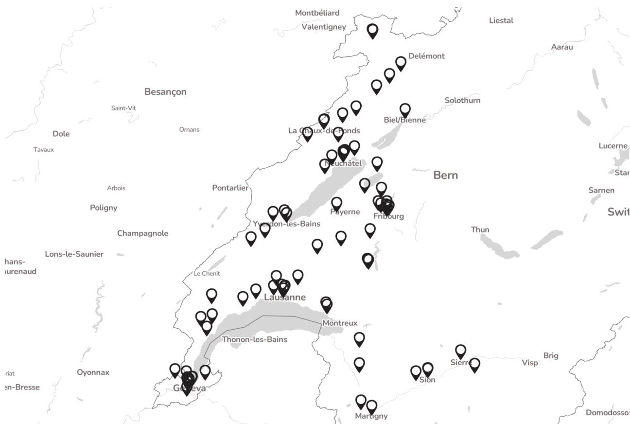
Carte représentant les épiceries signataires de la prise de position

Du côté des membres, 29 épiceries ont réglé leur cotisation 2025 (dont 18 faisant partie d'Epifri), ainsi qu'un membre de soutien 2 . Ceci n'est pas encore à la hauteur du nombre d'épiceries recensées dans le rapport des Artisans de la transition paru en novembre 2024 et de celles qui ont signé la prise de position : les prises de contact et le travail de recrutement ont été plus lourds et ont pris plus de temps que prévu. Mais grâce à un système de newsletter et à une liste d'épiceries et de contacts créée sur la base du rapport, en parallèle de recherches et de documents fournis par les Artisans de la transition, nous sommes ainsi très confiants sur le fait que la liste de nos membres s'agrandira très largement en 2026 !